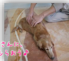
優しいセラピストさんに、じっくりゆるめてもらおう♪