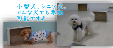
小型犬、シニア犬、 どんな犬でも参加 可能です♪