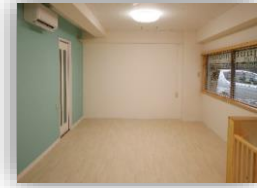
滞在中はフリス ® スでのびのび♪

※24時間スタッフ常駐サービスは終了いたしました。 ※お預かりサービスはトリミング・イベント等でプチソルをご利用いただいている方が対象となります。