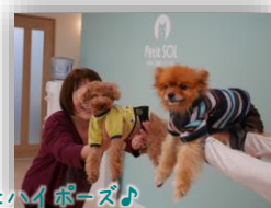
おともだちも一緒にハイポーズ♪